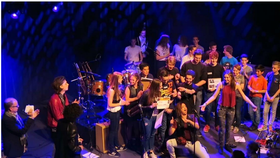
(foto van de uitreiking van de hoofdprijs op de finale dag. Te zien zijn links de juryleden. In het midden de bands REBADGED, daarachter de organisatie en de andere finalisten)

De media waren ook lovend over onze stichting en de Band Battle. Dit was duidelijk te zien in kranten en op nieuwswebsites. Een greep uit de krantenkoppen aangaande de Band Battle: 'Scholieren Breda helpen bands aan podium' – BN de Stem (4 december 2015), 'Scholierenbands naar Breda Barst' – BN de Stem (14 september '16)